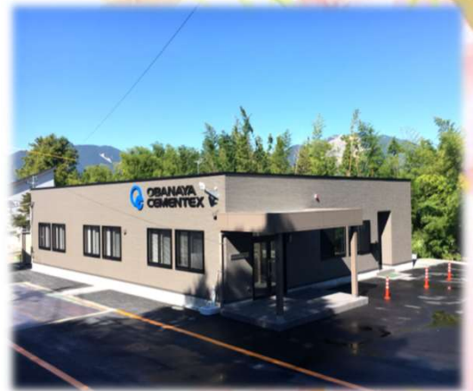
三重工場事務所 新築竣工