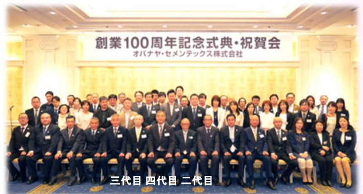
2017年 オバナヤ・セメントックス株式会社