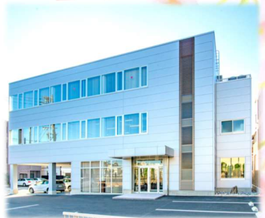
本社社屋 新築竣工