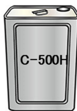
セメンテックス C-500H : 1.8kg