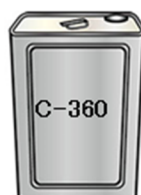
セメンテックス C-360 : 1.3kg