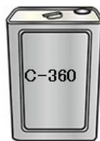
セメンテックス C-360 : 1.7kg