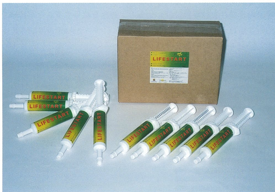
プロテキシン・ライフスタート (子豚・子牛用) 30ml×10本/1ケース