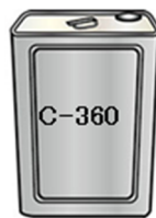
セメンテックス C-360 : 1.7kg